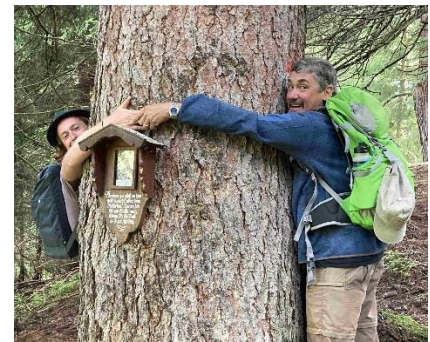
Lebewesen Baum, Aufbau Nockeralm - Bergwald im Naturschutzgebiet Valsertal, Tirol Station Baumrätsel

In diesem 2 tägigen Kurs werden Naturinteressierte auf eine spannende Reise in den „Bergwald“ mit seinen faszinierenden Lebensräumen & Mythen geführt.