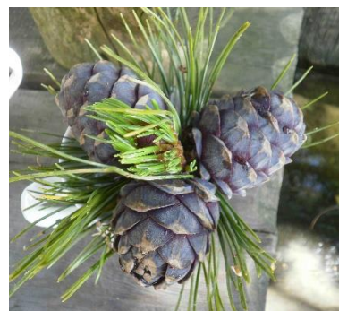
Früchte des Waldes

In diesem 2 tagigen Aufbaukurs erhalten Naturinteressierte eine Vertiefung zum Grundkurs Faszination Bergwald I - mit seinem fesselnden Kulturerbe fur die Menschheit . Die Teilnehmer werden dabei mit Aktivelementen auf eine spannende Zeitreise gefuhrt: