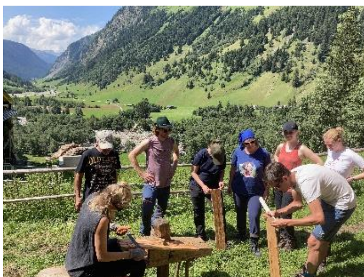
Handwerkzeuge im Bergwald: Baumfällung mit Axt und Säge; Holzschindel klieben – 3000 Jahre kelt. Kulturerbe