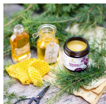
Salbe aus Lärchenpech