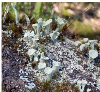
Wundervwelt der Flechten