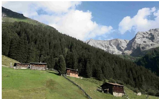
Nockeralm - Bergwald im Naturschutzgebiet Valsertal, Tirol